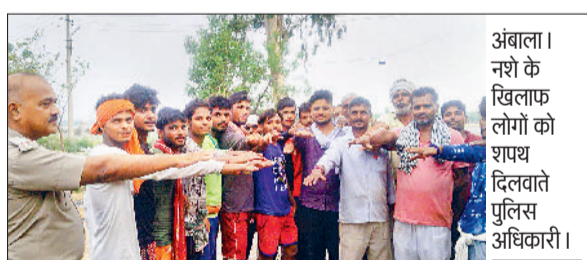
अंबाला। नशे के खिलाफ युवाओं को दिलवाई शपथ, पुलिस ने चलाया अभियान

पुलिस द्वारा जागरूकता नशामुक्त भारत अभियान चलाया जा रहा है। सोमवार को प्रबंधक थाना मुलाना ने युवाओं/आमजन को जागरूक कर नशे से दूर रहने बारे शपथ दिलाई गई। लोगों को बताया गया कि पुलिस द्वारा नशा तस्करो के खिलाफ कड़ी कार्रवाई की जा रही है और इसके साथ-साथ जिले में नशे की रोकथाम, नशे से दूर रहने, नशे के दुष्परिणामों बारे आम नागरिकों विशेषकर युवाओं को जागरूक करने के लिए जागरूकता अभियान की भी शुरुआत की गई है, जिससे कि नागरिक विशेषकर युवा नशे से