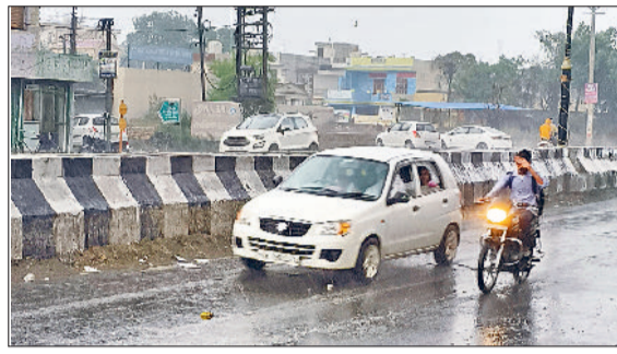
कुरुक्षेत्र। बारिश में अपने गंतव्य की ओर जाते वाहन चालक।

■ झमाझम बारिश से किसानों के चेहरे खिल उठे। शाम को बारिश होने से लोगों को कुछ राहत मिली। शाम को करीब 40 मिनट तक तेज बारिश हुई। जिससे सड़कों पर पानी बह निकला। दिनभर गर्म हवा व उमस ने लोगों को बेहाल किया। पिछले दिनों हुई बारिश के बाद लोगों को गर्मी से थोड़ी राहत मिली थी, लेकिन अब तेज धूप के कारण वापस गर्मी और उमस से लोगों का हाल बेहाल है। सोमवार को सुबह ही तेज धूप निकलने से 11 बजे तापमान 33 डिग्री पहुंच