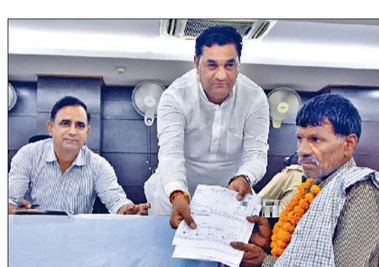
पानीपत। समाधान शिविर में उपायुक्त डॉ. वीरेंद्र दहिया व भाजपा नेता शिकायतकर्ता का स्वागत करते हुए।

पानीपत की जनता की समस्याओं के निदान को लेकर लगाये जा रहे समाधान शिविर में शिकायतकर्ताओं की समस्या का समाधान हो रहा है। सोमवार को जिला सचिवालय सभागार में लोन अपनी समस्याओं के समाधान को लेकर पहुंचे। उपायुक्त डा.वीरेंद्र दहिया ने बताया कि वे हर हाल में लोगों की समस्या का समाधान चाहते हैं। डॉ. दहिया ने अधिकारियों को निर्देश दिए कि वे समस्या को