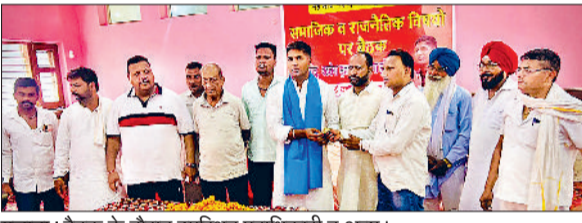
मुलाना। बैठक के दौरान उपस्थित पदाधिकारी व अन्य।