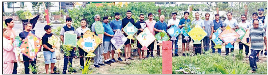
पानीपत। अंसल के गेट पर पौधारोपण करते फ्लाईंग क्लब ट्रस्ट के सदस्य व अन्य।

हरिभूमि न्यूज पानीपत फ्लाईंग क्लब ट्रस्ट के सदस्यों ने अपने प्रोजेक्ट मिशन ग्रीन के तहत अंसल सुशांत सिटी गेट नंबर दो के बाहर 100 पौधे लगाए। जिसमें डीएसपी सतीश वत्स भी मुख्य रूप से उपस्थित रहे और कई जाने माने उद्योगपति भी पहुंचे। सभी ने अपने