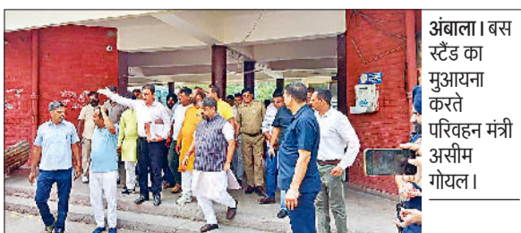
अंबाला। बस स्टैंड का मुआयना करते परिवहन मंत्री असीम गोयल।