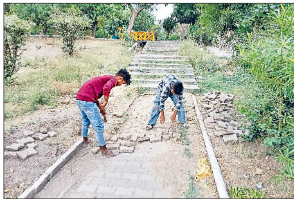
नारायणगढ़। नवाब जस्सा सिंह अहलुवालिया पार्क में चल रहे कार्य का दृश्य।