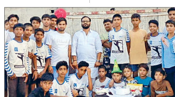
पानीपत। विश्व हैंडबॉल दिवस पर खेल के मैदान पर केक काटते खिलाड़ी।

शराब के साथ पकड़ा पानीपत। समालाया पुलिस ने मुखबिार की सूचना पर ईश्वर निवासी गांव राखसेहड़ा जिला पानीपत को 10 लीटर कच्ची अवैध शराब के साथ गिरफ्तार किया है।