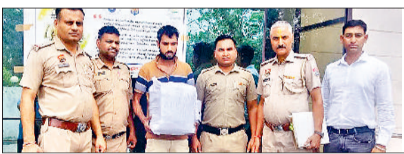
यमुनानगर में गांजा पत्ती के साथ गिरफ्तार किया गया आरोपी।

आरोपित से 9 और पुलिस किलों 640 अ धी क्ष क ग्राम गांजा नि ति का बरामद किया गहलोट के दिशा निर्देशों पर प्रदेश भर में नशातस्करों पर शिकंजा कसने के लिए कड़ी कार्रवाई कर रही है। इसी कड़ी में कंट्रोल ब्यूरो की अंबाला यूनिट की