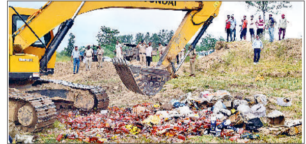
जेसीबी से शराब को नष्ट करते हुए।