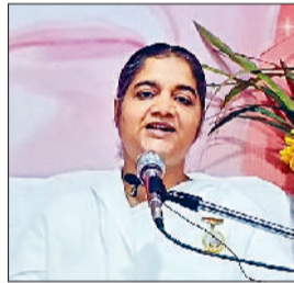
अंबाला। नशे के खिलाफ युवाओं को दिलवाई शपथ, पुलिस ने चलाया अभियान

थी। यद्यपि वे बहुत छोटी थीं, फिर भी सभी उन्हें हृदय से रममार कहते थे। यहाँ तक कि उनकी अपनी मां भी। उनकी पवित्र शक्तिशाली दृष्टि कई लोगों के हृदय को पिघला देती थी। उन्होंने कई लोगों को नया जीवन दिया। कई लोगों को उनकी दृष्टि से ही नई स्वर्णिम दुनिया के दिव्य दर्शन हुए। उनकी विवेक शक्ति अद्भुत थी।