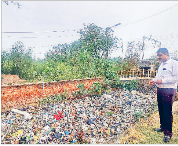
अंबाला। इंसो नाले में अटी गंदगी का मुआयना करते डिप्टी मेयर व जलभराव का दृश्य।